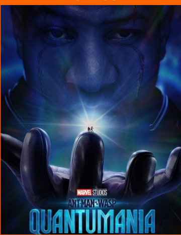
Ant-Man et la guêpe : Quantummania De Peyton Reed Durée : 2h15 Genres : Action, Science fiction