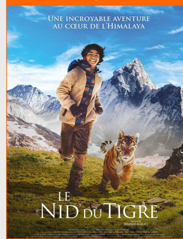
Le Nid du Tigre De Brando Quilici Durée : 1h34 Genres : Aventure, famille