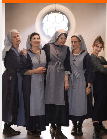
Juste ciel ! De Laurent Tirard Durée : 1h37 Genre : Comédie