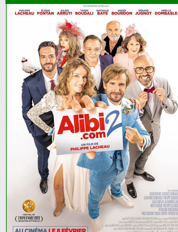
Alibi.com 2 De Philippe Lacheau Durée : 1 h 35 Genre : Comédie