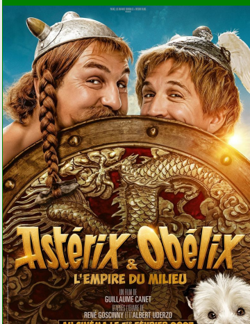
Astérix & Obélix : L'Empire du milieu De Guillaume Canet Durée : 1h54 Genres : Aventure, Comédie