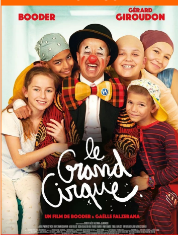
Le Grand Cirque De Booder, Gaele Falzerana Durée : 1h25 Genre : Comédie