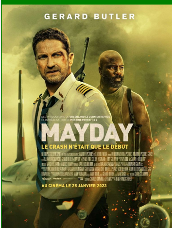
Mayday De Jean-François Richet Durée : 1h47 Genres : Action, Thriller