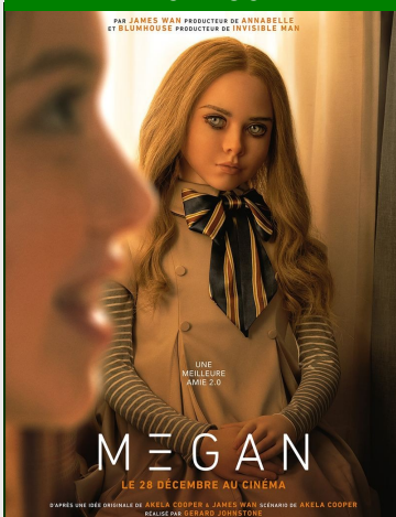
M3GAN De Gerard Johnstone Durée : 1h42 Genres : Epouvante-horreur, Thriller