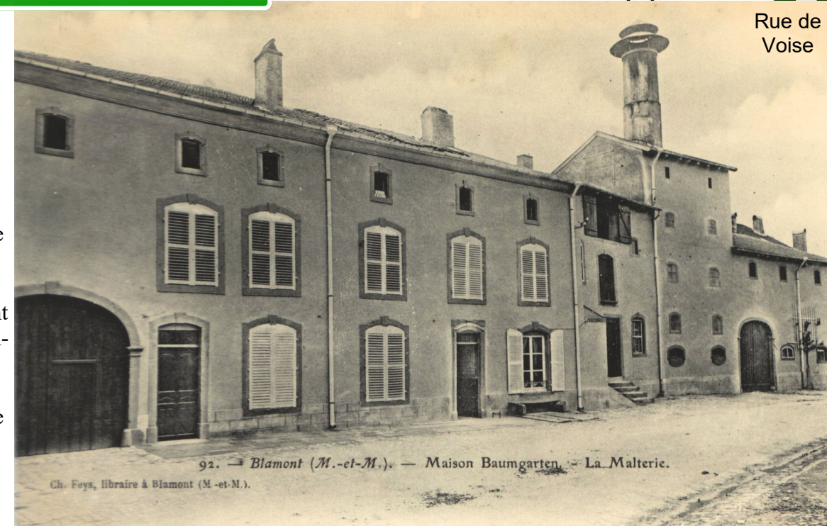
Rue de Voise

Parmi les industries blâmontaises fort peu documentées, citons celle de la bière. Si la cervoise remonte à l'antiquité, la bière, houblonnée, apparaît en 1588 dans la Lorraine du duc Charles III, qui en organise la production au couvent des cordeliers de Nancy. Dès 1617, Jean Courtois de Blâmont obtient le privilège de fabriquer de la bière, et en 1641 on trouve la trace de livraison à l'abbaye de Domèvre