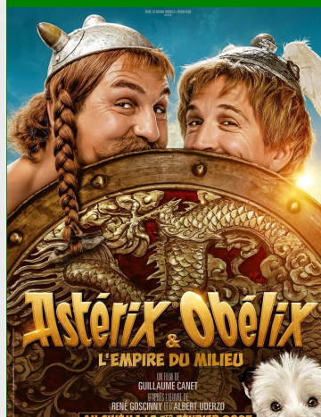
Astérix & Obélix : L'Empire du milieu De Guillaume Canet Durée : 1h54 Genres : Aventure, Comédie