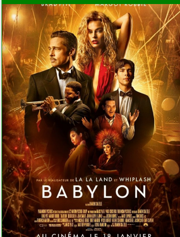
Babylon De Damien Chazelle Durée : 3h09 Genres : Historique, Drame