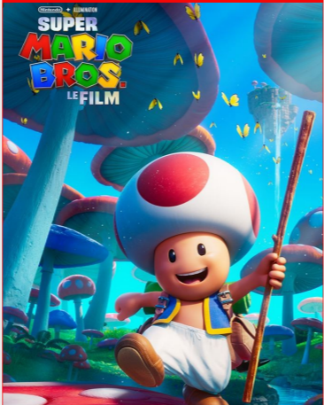
Super Mario Bros, le film De Aaron Horvath, Michael Jelenic Durée : 1h26 Genre : Animation, Aventure