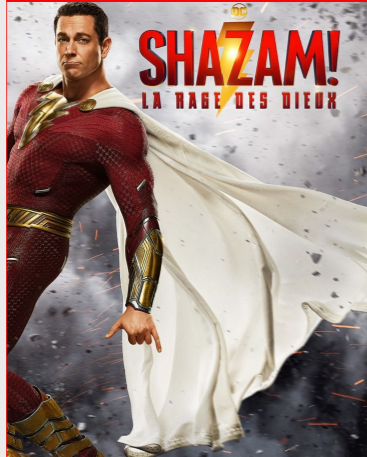
Shazam! La Rage des Dieux De David F. Sandberg Durée : 2h10 Genre : Fantastique, Aventure