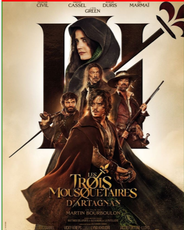
Les Trois Mousquetaires : d'Artagnan De Martin Bourboulon Durée : 2h01 Genre : Aventure, Historique