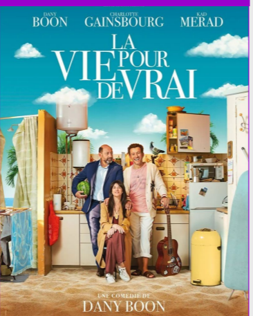
La vie pour de vrai De Dany Boon Durée : 1h50 Genre : Comédie