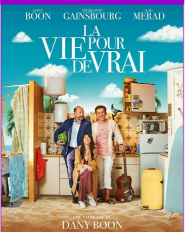
La vie pour de vrai De Dany Boon Durée : 1h50 Genre : Comédie