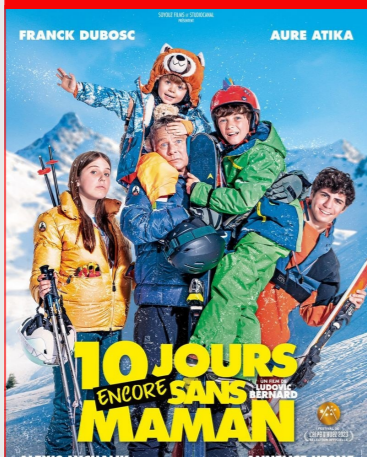
10 jours encore sans maman De Ludovic Bernard Durée : 1h32 Genre : Comédie