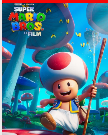
Super Mario Bros, le film De Aaron Horvath, Michael Jelenic Durée : 1h26 Genre : Animation, Aventure