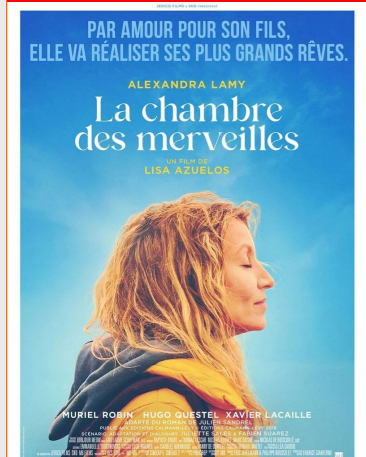
La Chambre des Merveilles De Lisa Azuelos Durée : 1h34 Genre : Drame