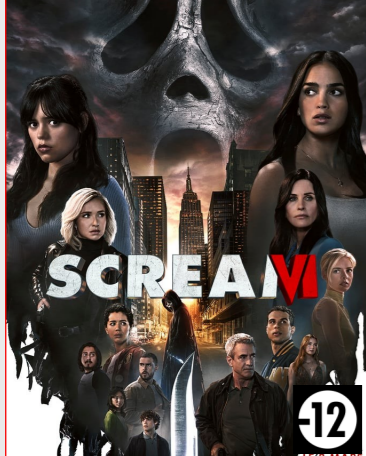
Scream VI De Matt Bettinelli-Olpin, Tyler Gillett Durée : 2h03 Genre : Epouvante-horreur