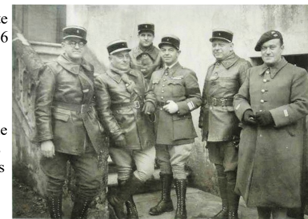
Bon Accueil - décembre 1939 Officiers du 1 er BCC

De Gaulle quitte la Lorraine le 26 avril 1940, quinze jours avant que ses craintes ne se réalisent lorsque Hitler lance ses armées blindées sur la France.