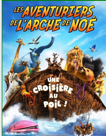
Les aventuriers de l'arche de Noé De Sérgio Machado, Alois Di Leo Durée : 1h35 Animation, Comédie musicale