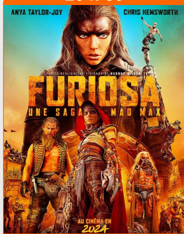
Furiosa : une saga Mad Max De George Miller Durée : 2h20 Action, Science Fiction