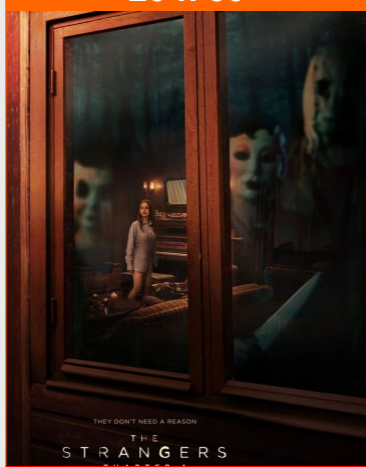
The Strangers : Chapter 1 De Renny Harlin Durée : 1h31 Epouvante-horreur, Thriller

De très bons acteurs sont à l'affiche du film « je verrai toujours vos visages ». Le film sera diffusé le dimanche 2 juin exceptionnellement à 15 heures, pour permettre aux spectateurs de participer au débat prévu après la projection.