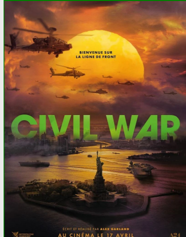
Civil war De Alex Garland Durée : 1h49 Action, Drame, Science Fiction