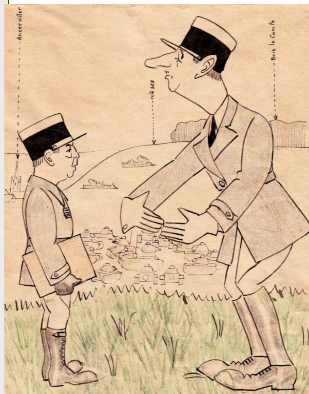
Caricature représentant le colonel Charles de Gaulle et le commandant Louis Warabiot (au centre, sur la photo de droite), lors des manoeuvres de Blâmont le 8 mars 1940