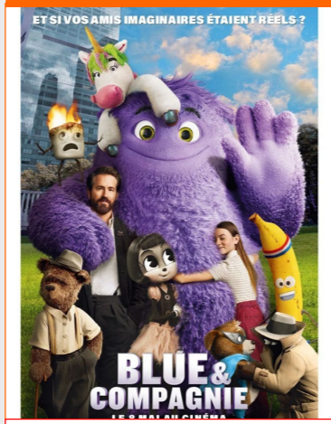
Blue & Compagnie De John Krasinski Durée : 1h37 Comédie, Famille, Fantastique