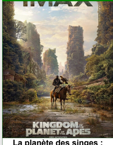
La planète des singes : le nouveau royaume De Wes Ball Durée : 2h25 Action, Aventure, Science Fiction