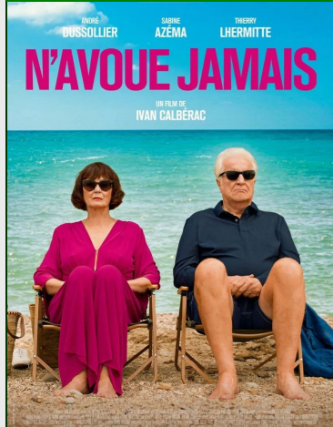
N'avoue Jamais De Ivan Calberac Durée : 1h30 Comédie