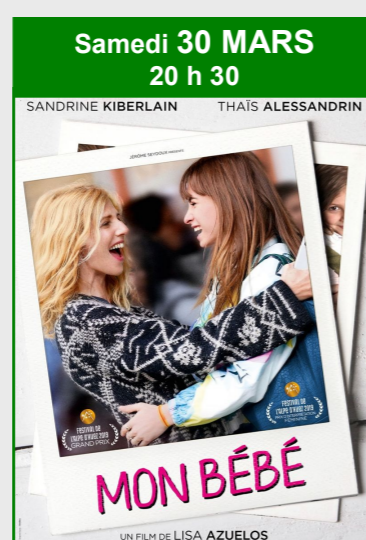
Samedi 30 MARS 20 h 30 MON BÉBÉ De Lisa Azuelos Durée : 1h27 Genre : Comédie dramatique