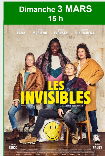
Dimanche 3 MARS 15 h LES INVISIBLES De Louis-Julien Petit Durée : 1h42 Genre : Comédie