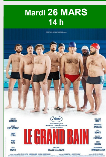
Mardi 26 MARS 14 h LE GRAND BAIN De Gilles Lellouche Durée : 2h02 Genre : Comédie