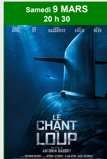
Samedi 9 MARS 20 h 30 Le chant du loup De Antonin Baudry Durée : 1h55 Genre : Drame