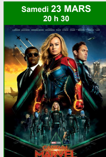
Samedi 23 MARS 20 h 30 Captain Marvel De Anna Boden, Ryan Fleck Durée : 2h12 Genres : Action, Fantastique