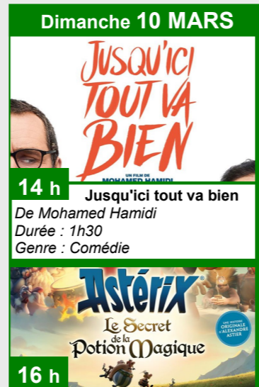
Dimanche 10 MARS JUSQU'ICI TOUT VA BIEN 14 h De Mohamed Hamidi Durée : 1h30 Genre : Comédie