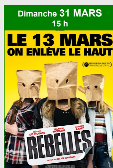
Dimanche 31 MARS 15 h LE 13 MARS ON ENLÈVE LE HAUT REBELLES De Allan Mauduit Durée : 1h27 Genre : Comédie