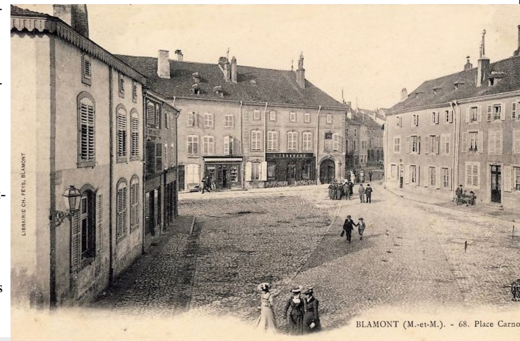
BLAMONT (M.-et-M.). - 68. Place Carnot

Mais surtout, cette carte postale montre très nettement la route nationale, dont la structure pavée diffère fortement du reste de la place, et que la RD400 suit encore très fidèlement aujourd'hui. Depuis cette carte postale, rien n'a finalement changé, hormis que la place remplace les bâtiments : route, trottoirs, largeur, tout est encore là un siècle plus tard, et on conçoit aisément qu'il convient aujourd'hui, dans les projets 2019, de moderniser ce lieu de trafic, où il n'est plus possible de cheminer aussi aisément sur la chaussée.