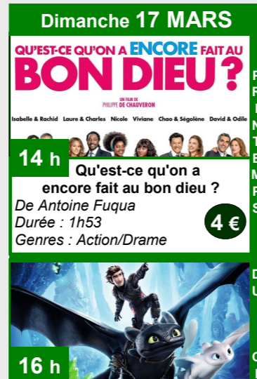
Dimanche 17 MARS QU'EST-CE QU'ON A ENCORE FAIT AU BON DIEU ? 14 h De Antoine Fuqua Durée : 1h53 Genres : Action/Drame 4 €