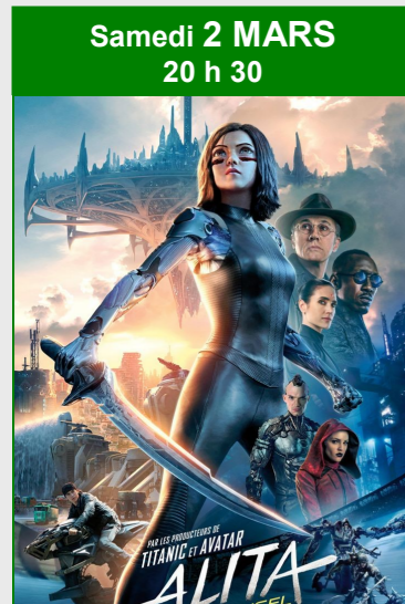
Samedi 2 MARS 20 h 30 Alita : Battle Angel De Robert Rodriguez Durée : 2h02 Genres : Science fiction, Action