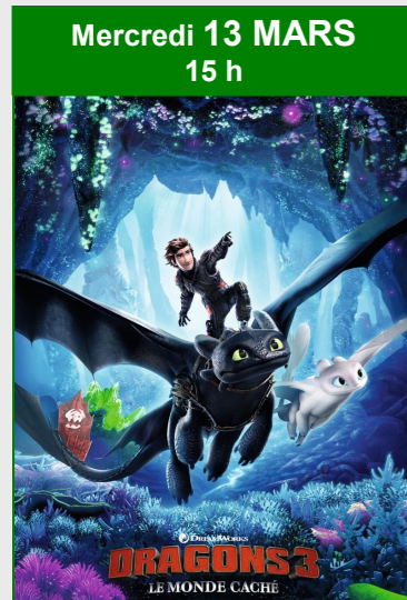
Mercredi 13 MARS 15 h Dragons 3 : Le monde caché De Dean DeBlois Durée : 1h44 Genres : Animation, Aventure