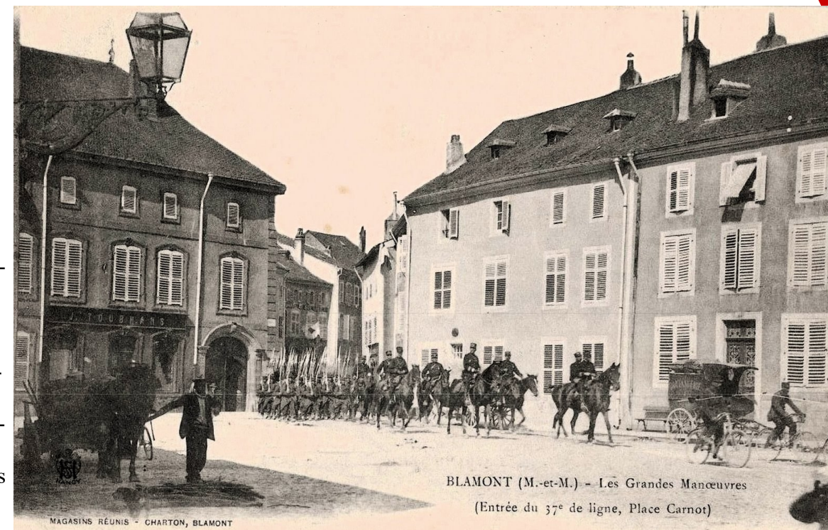
BLAMONT (M.-et-M.) - Les Grandes Manœuvres (Entrée du 37 e de ligne, Place Carnot)

Depuis 1871 et jusqu'à la première guerre mondiale, Blâmont est proche de la frontière allemande, à Avricourt au nord, à Richeval vers l'est. La ville sera donc le lieu de plusieurs grandes manœuvres de l'armée française, comme en septembre 1900, celle de la 11 ème division, dont le 37 ème régiment d'infanterie parade ici, de la Grande Rue vers la place Carnot (rue du 18 novembre actuelle, vers la place du Général de