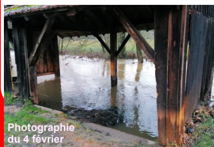
Photographie du 4 février

Les premiers travaux sur le lavoir (voir bulletin n° 39 - octobre 2019) ont évité à l'ancienne structure branlante d'être emportée par la crue du 4 février. Une bonne étoile veille sans doute sur ce lavoir, puisque la réfection du toit, entamée le 11 février, intervient providentiellement 24 heures après le passage de la tempête Ciara, évitant ainsi tout risque de dégâts sur une toiture neuve.